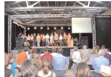
Aufführung in der Spettergarage