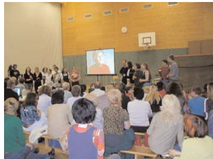
Aufführung im Turnsaal der bilingualen Mittelschule