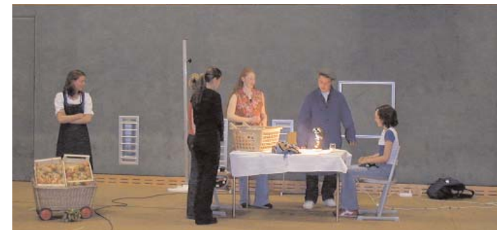
Szenen aus der Aufführung des Erinnerungstheaters vom 02.06.04, im Tumsaal der bilingualen Mittelschule