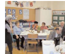
SeniorInnenreffen in der bilingualen Mittelschule Koppstasse, Thema: Über alte Zeiten plaudern