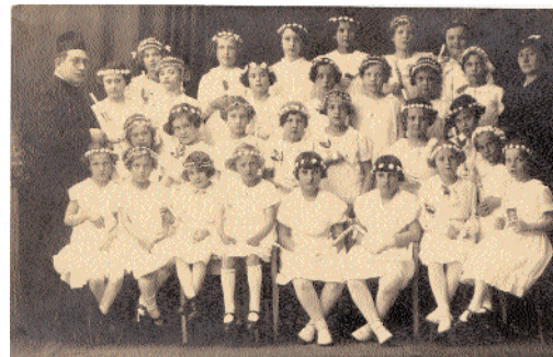
"Über alte Zeiten plaudern"