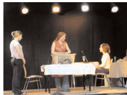
Szene aus der Aufführung des Erinnerungstheaters vom 07.Juni 2004 im Turnsaal der Vienna Bilingual school