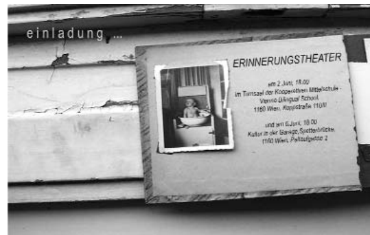
Einladung zum Erinnerungstheater

Die Gebietsbetreuung Ottakring bearbeitet seit 2003 gemeinsam mit den BewohnerInnen einer städtischen Wohnhausanlage und den SchülerInnen der benachbarten Schule die Probleme, die aus der Nachbarschaft entstehen. So wurde im Herbst 2003 erfolgreich eine Forumtheateraufführung zum Thema durchgeführt. In diesem Jahr steht der Verständigungsprozess zwischen Jung und Alt weiter im Vordergrund.