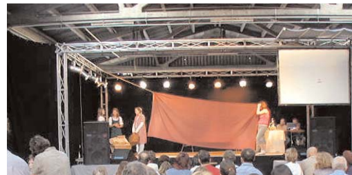
Die Kostüme und Materialien für die Aufführungen wurden teilweise von den SchülerInnen selbst gemacht