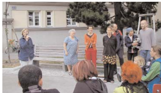
Forumtheateraufführung im Sandleitenhof