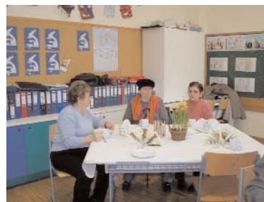
SeniorInnenabend in der Schule

Im Anschluss an den SeniorInnennachmittag und den