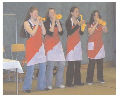
Aufführung im Tumsaal der bilingualen Mittelschule