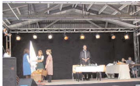
Szenen aus der Aufführung vom 6. Juni 2004

Verliebtheit der halben Klasse in den Lateinprofessor Kohleferien - weil es zu kalt war, um ausreichend Kohle für die Heizung in der Schule aufzubringen Bei Bombenangriffen wurde "Kuckuck" gerufen Strandeln gehen = spazieren gehen und Schule schwän-