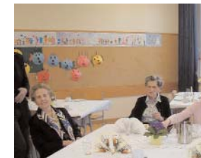
SeniorInnentreffen in der bilingualen Mittelschule Kopfstasse, Thema: Über alte Zeiten plaudern