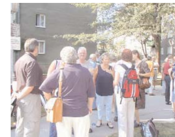
Begehung des Lebensraums der Wohnhausanlage