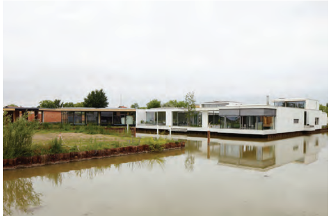
Am Hafen Neusiedl am See; Architektur Halbritter & Hillerbrand

Architekturtage 2012 01–02 Juni www.architekturtage.at