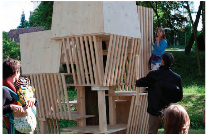
Stadtpark Horn