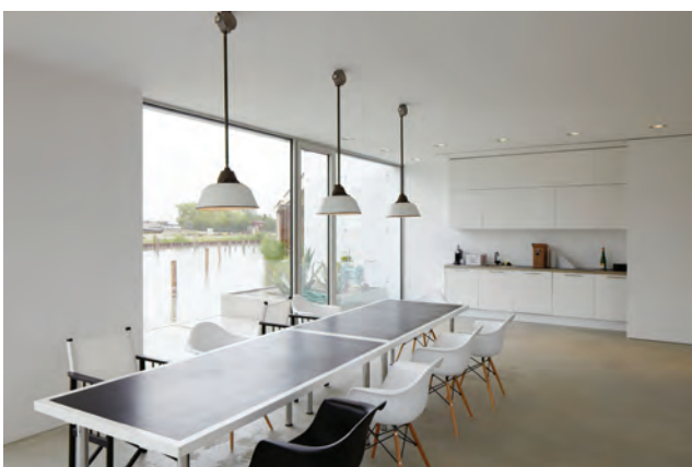
Am Hafen Neusiedl am See; Architektur Halbritter & Hillerbrand

Am Samstag wurde der Programmpunkt “Architektur unterwegs” mit ca. 50 TeilnehmerInnen durchgeführt. Von Neusiedl am See bis Neckenmarkt konnten mehrere Gebäude vor Ort besichtigt werden. Bei allen Projekten waren die ArchitektInnen des jeweiligen Bauwerkes vor Ort und es wurde angeregt über den Planungsprozess und die Umsetzung diskutiert.