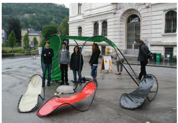
dat explores supertext; Foto Jana Breuste