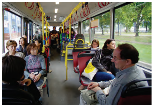
Bustouren Wiener Linien