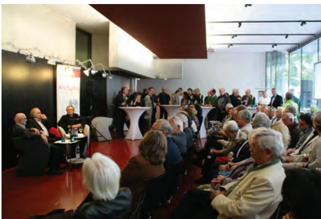
Eröffnung in der Kammer der Architekten und Ingenieurkonsulenten; Foto Jana Breuste

Unter den 13 offenen Ateliers stach das Bürofest von mayer&seidl architekten mit Life-Musik-Darbietungen, Lesungen und Ausstellungen hervor und lockte mehr als 100 BesucherInnen an. Anders als geWohnt war der offene Atelieranbau von novac-architects, das die Verbindung von Lärchenholz, Beton und Leder zelebrierte.