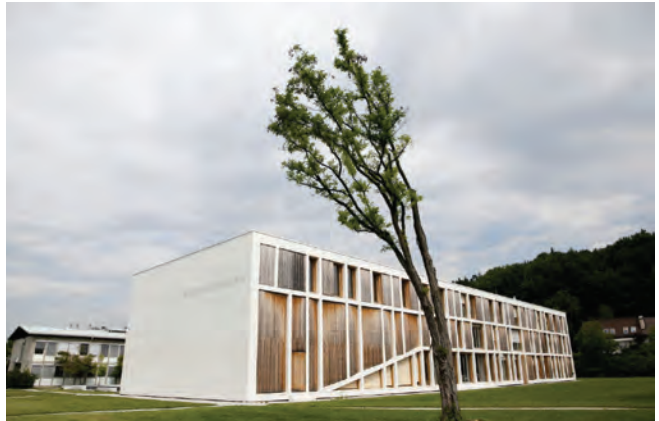
Biotechnical Faculty in Ljubljana; Architektur Krušec

Architekturtage 2012 01–02 Juni www.architekturtage.at