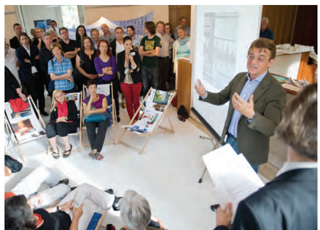
KALT und WARM