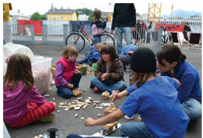
Kinderprogramm in Lehen; Foto Sarah Untner