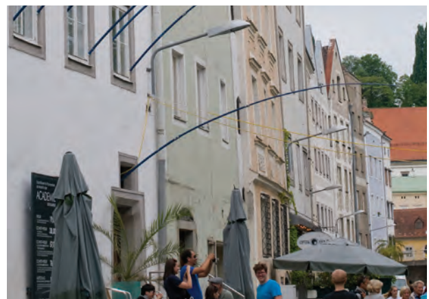
Wohnzimmer am Ennskai