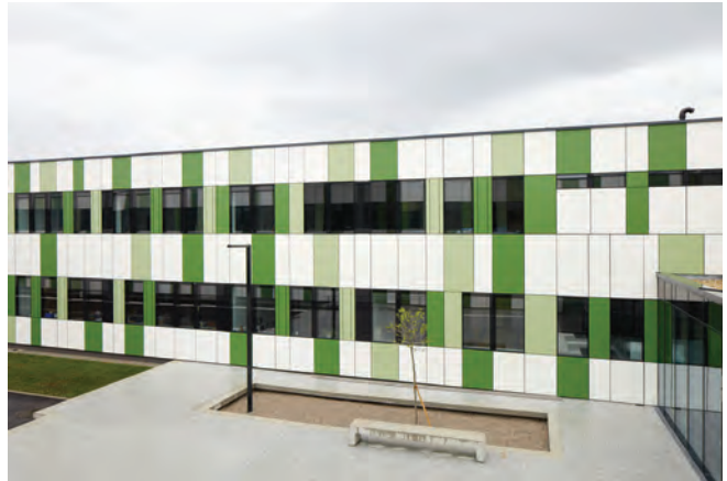
BRG Neusiedl am See; Architektur k2architektur SOLID architecture

Weiters gab es auch die Möglichkeit mehrere Einfamilienhäuser beim Programmpunkt "Architektur Visite" zu besuchen. In Neusiedl am See, in Zurndorf und in Kitzladen waren zahlreiche BesucherInnen vor Ort und konnten mit den ArchitektInnenen und BauherrInnen in Dialog treten.