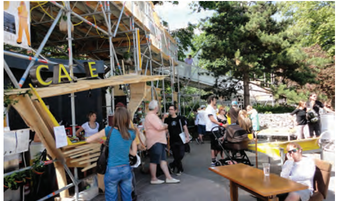
stattSTUBE Innsbruck; Architektur Tortenwerkstatt

Allein am Samstag, wo die stattSTUBE zur Bühne für Konzerte des „HEART OF NOISE“-Festivals und zur Schnittstelle des erstmalig stattfindenden Stadtteilstests ANPRUGGEN zwischen Mariahilf und St. Nikolaus wurde, belebten rund 5.000 Menschen diesen neuen Freiraum in der Stadt, der bis September 2012 von den InnsbruckerInnen „anders als geWohnt“ in Besitz genommen werden kann.