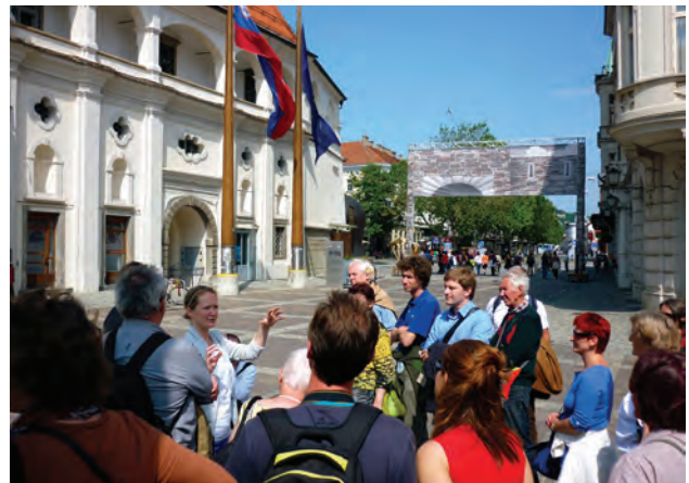
Gradec Marburg