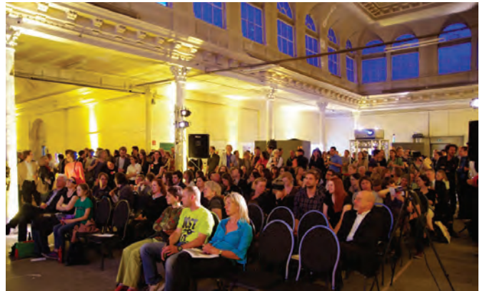
Eröffnungsfest im Etablissement Gschwandner

Architekturtage 2012 01–02 Juni www.architekturtage.at