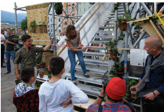
stattSTUBE Innsbruck; Architektur Tortenwerkstatt

Über 700 BesucherInnen feierten gemeinsam mit aut und der Tortenwerkstatt am Donnerstag bis spät in die Nacht die Eröffnung der Architekturtage, u. a. bei einem STUBENkonzert von Times New Roman. Am Freitag und am Samstag war die stattSTUBE der zentrale Ort der Architekturtage in Tirol, wo in Kooperation mit anderen Kulturinitiativen Veranstaltungen für Publikum aller Altersstufen angeboten wurden.