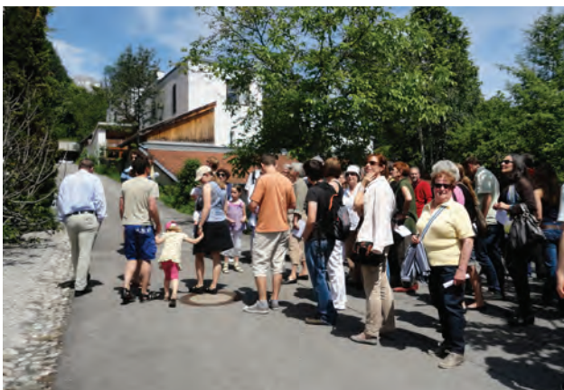
Siedlung Pumpilgahn in Innsbruck; Architektur Norbert Fritz; Foto aut

Text: Claudia Wedekind // aut. architektur und tirol