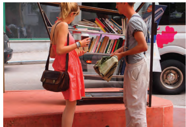
Open Book Box; Foto Margit Greinöcker