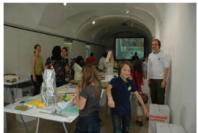
ibini Kinderworkshop: Foto Vilja Cortolezis