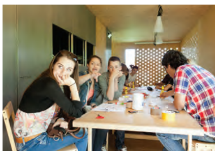
Vorarlberg; Foto vai