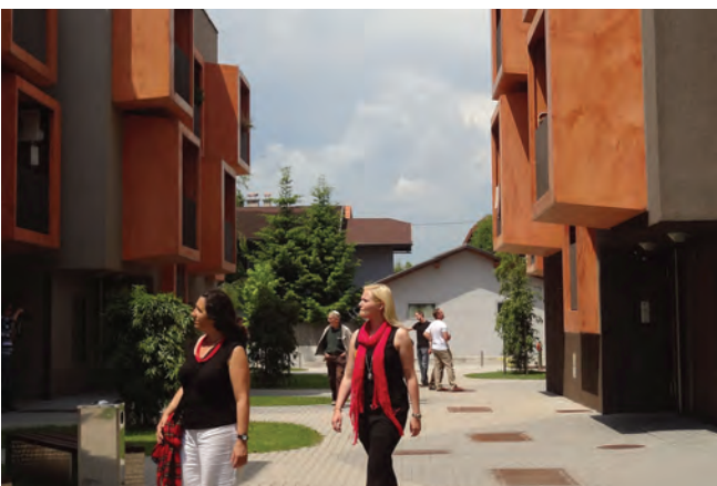
Housing Jurkova in Ljubljana; Architektur enota; Foto Barbara Steiner

Text: Raffaella Lackner // ArchitekturHaus Kärnten