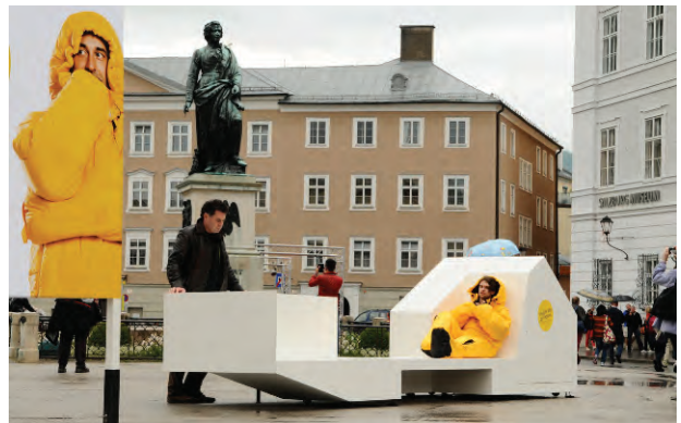
Wohn.info.mobil am Mozartplatz; Foto Emilio Ganot

Architekturtage 2012 01–02 Juni www.architekturtage.at