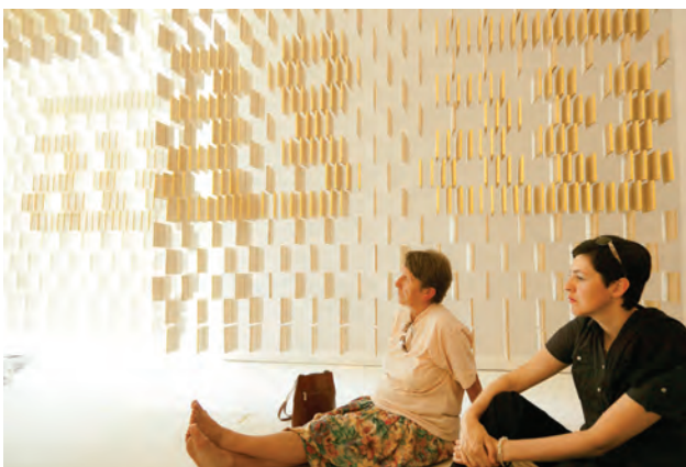
Islamischer Friedhof Altach; Architektur Bernardo Bader, Azra Akšamija

Text: Marina Hämmerle, Claudine Pachnicke // vai Vorarlberger Architektur Institut