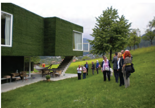
EFH surplus value01; Architektur weichlbauer/ortis

Text: Markus Bogensberger // HDA Haus der Architektur