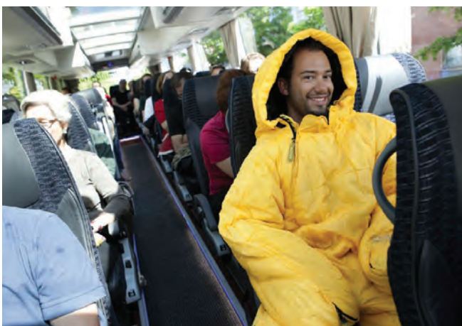
Tour Ljubljana / Laibach

In Kooperation mit den KULTUR RAD PFADEN wurde eine Radtour zu verschiedenen Wohnformen in Klagenfurt organisiert. Mehr als 40 TeilnehmerInnen besuchten 10 Gebäude unter fachkundiger Führung. Zusätzlich begleitete Georg Wald von der Stadtplanung die Radler mit Erläuterungen zur Klagenfurter Wohnbauentwicklung.