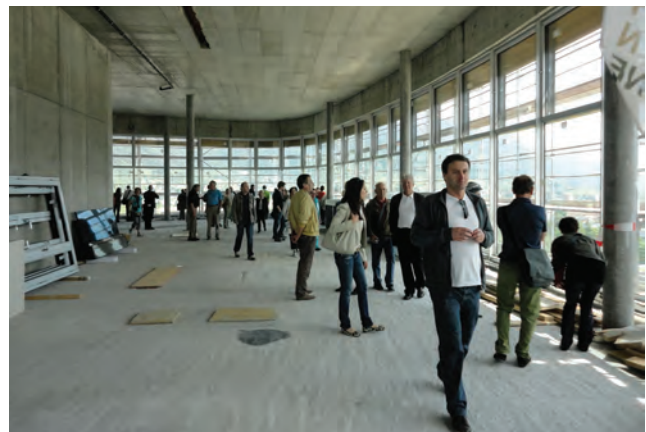
HochHausen im Headline Innsbruck; Architektur henke und schreieck; Foto aut