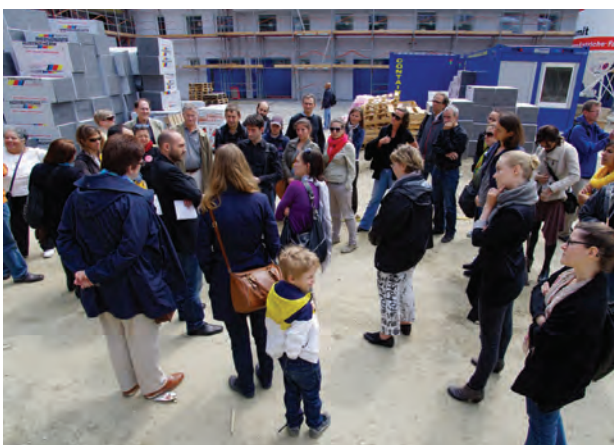
Geführte Gebäudetouren

Das Wien-Bratislava-Programm stand unter dem Ehrenschutz von Bürgermeister Dr. Michael Häupl. Zur Eröffnung am Donnerstag, 31. Mai, im historischen Etablissement Gschwandner kamen über 600 Gäste, mit Präsentationen von departure, der Kreativagentur der Stadt Wien, der pecha kucha night vienna sowie der Eröffnung durch die ÖGFA Österreichische Gesellschaft für Architektur wurden die Architektur und ihre AkteurInnen bei Musik, Speis und Trank gefeiert.