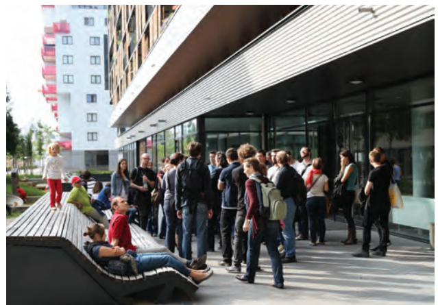
Geführte Tour „Bike City“; Foto Monika Schuller