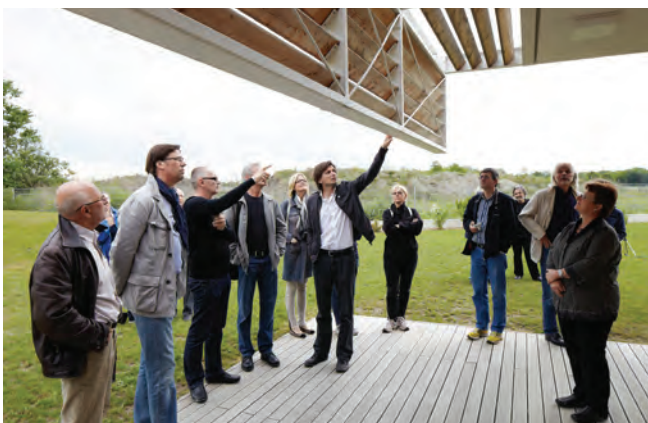
Kindergarten Neufeld; Architektur SOLID architecture

Text: Heinz Gerbl // ARCHITEKTUR RAUMBURGENLAND