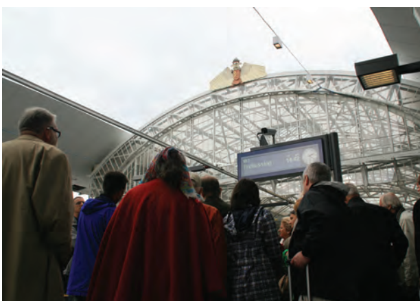
Abfahrt nach Freilassing

Text: Jana Breuste // INITIATIVE ARCHITEKTUR salzburg