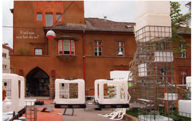
Vorplatz des afo in Linz

Architekturtage 2012 01–02 Juni www.architekturtage.at