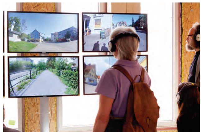
Authentische Stadtansichten; Foto Christian Grass