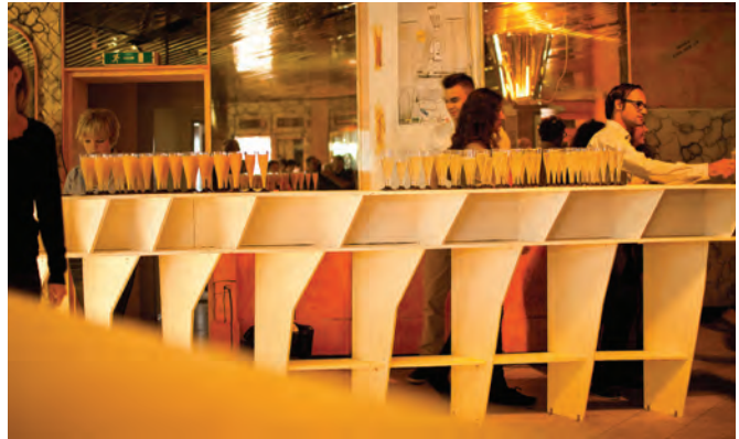
Offensichtliche Privatangelegenheiten; die Bar