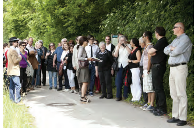
Tour Ljubljana / Laibach

Die Arbeitsgruppe „Billig Bauen“ vom ArchitekturHaus Kärnten lud zu einem Symposium der anderen Art. Mit gezielten Fragen wurde zur Entwicklung des Wohnbaus und den Zielen der Kärntner Wohnbauförderung geforscht und von den KünstlerInnen Max Achatz und Kathrin Ackerl Konstantin durch eine szenische Lesung präsentiert.