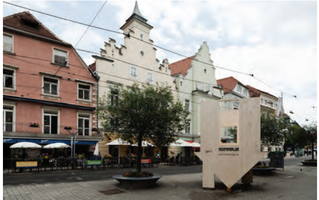
Hausnummer 180

Architekturtage 2012 01–02 Juni www.architekturtage.at