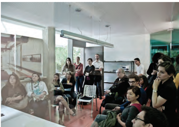
Offenes Atelier

Vor 10 Jahren fand in Graz der Start der Ausstellungstournee „Frische Fische“ statt. 22 junge Büros stellten damals ihre Denk- und Arbeitsweise in anschaulicher Form aus und postulierten damit eine neue Generation „frischer“ Architekturschaffender. Im Rahmen der Architekturshow zeigen diese Büros ihre Arbeiten seit 2002 unter dem Aspekt des „anders als geWohnt“. Auf diese Weise ergab sich ein spannender Blick auf das junge Architekturgeschehen der letzten Jahre sowie gegenwärtige Tendenzen in Graz und darüber hinausgehend.