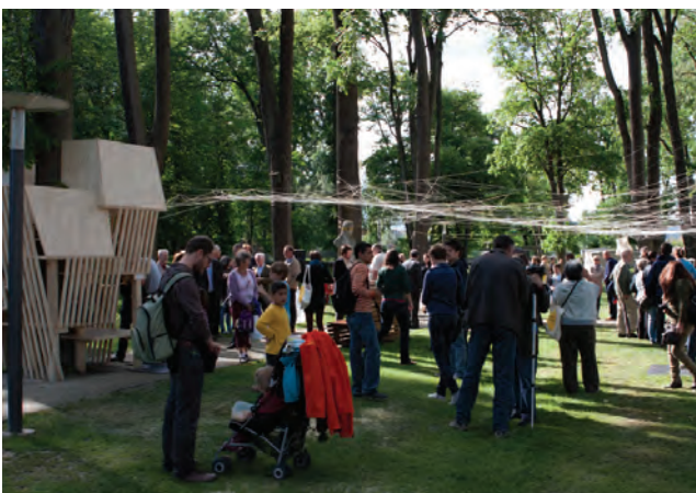
Stadtpark Horn

Text: Heidrun Rabl // ORTE Architekturnetzwerk Niederösterreich