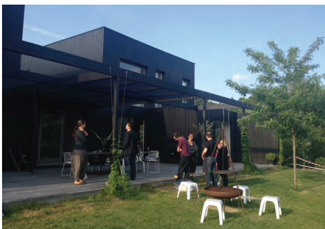
Haus Hadersfeld; Architektur triendl und fessler

Ein besonderes Highlight bildete der Baumhaus-Schwerpunkt in Horn: Studierende der Fakultät für Architektur und Raumplanung der TU Wien haben unter dem Titel ‚Oben im Baum‘ sechs Baumhausprojekte, die im Vorfeld von einer Jury ausgezeichnet wurden, im Stadtpark von Horn realisiert. ORTE hat diese dann gemeinsam mit der Stadtgemeinde Horn am 1. Juni der Öffentlichkeit präsentiert. Etwa 140 Personen kamen, um zu sehen, wie viel Kreativität der scheinbar ewige Traum vom Baumhaus hervorbringt und wie weit gefasst die Vorstellung vom Baumhaus sein kann. Kinder haben nicht gezögert und die Objekte sogleich erprobt.