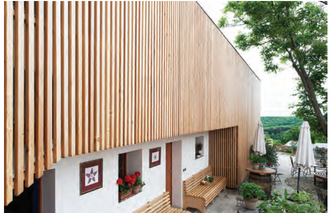
Windmühlenheureriger in Retz; Architektur i-arch

Architekturtage 2012 01–02 Juni www.architekturtage.at