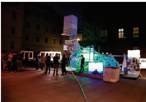
Vorplatz des afo in Linz; Foto Margit Greinöcker

Samstags nutzten viele Interessierte die Shuttlebusse in Richtung Steyr mit der Möglichkeit zur Besichtigung von besonderen Wohnobjekten und Führungen durch die Architekten (Gugl Mugl, Linz und Les Paletuviers in Neuhofen a.d.Krems von Fritz Matzinger; das Haus S. in Steyr von kienesberger schröckenfuchs; das voestalpine Innovationszentrum in Linz des Architekturbüros rohling; Haus Aichinger, Kronstorf von Gernot Hertl; Umbauten Dragonerkaserne Wels durch Luger & Maul).