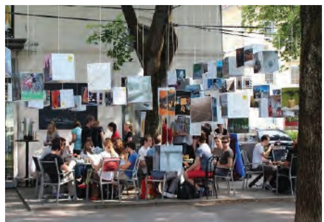
Bildwettbewerb „anders als geWohnt“