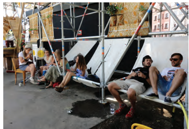
stattSTUBE Innsbruck; Architektur Tortenwerkstatt