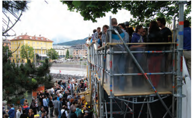
stattSTUBE Innsbruck; Architektur Tortenwerkstatt

Architekturtage 2012 01–02 Juni www.architekturtage.at