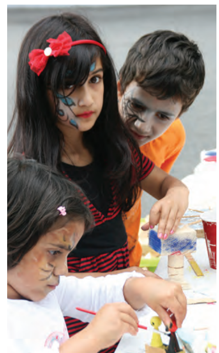
Salzburg; Foto Jana Breuste