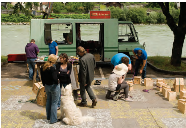
Wohnzimmer am Ennskai