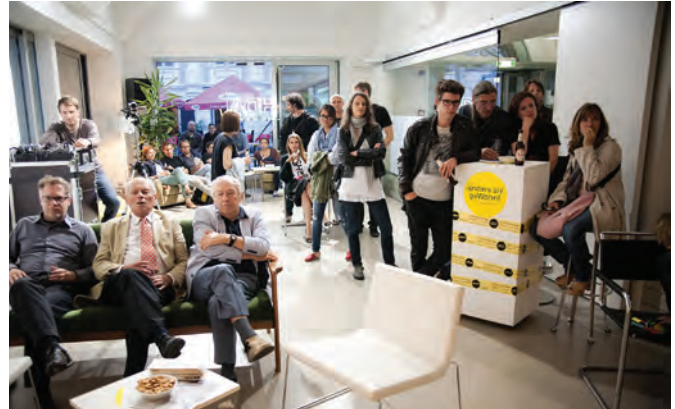
Eröffnung Architekturtage im HDA; Foto Thomas Raggam