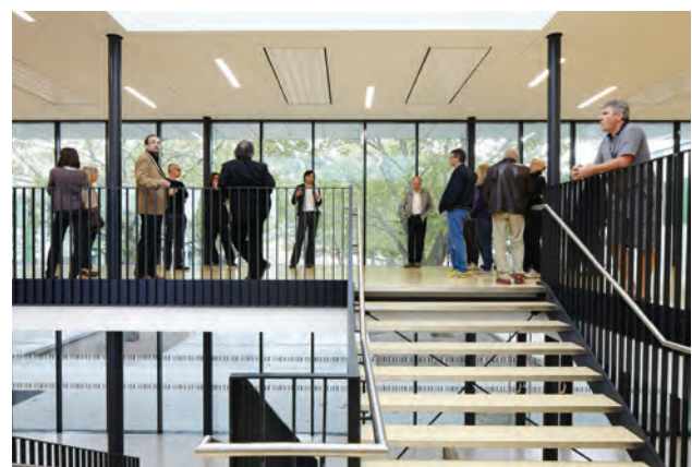
BRG Neusiedl am See; Architektur k2architektur SOLID architecture; Foto Rainer Schoditsch