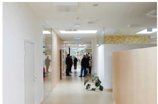
Kindergarten Neufeld; Architektur SOLID architecture; Foto Rainer Schoditsch