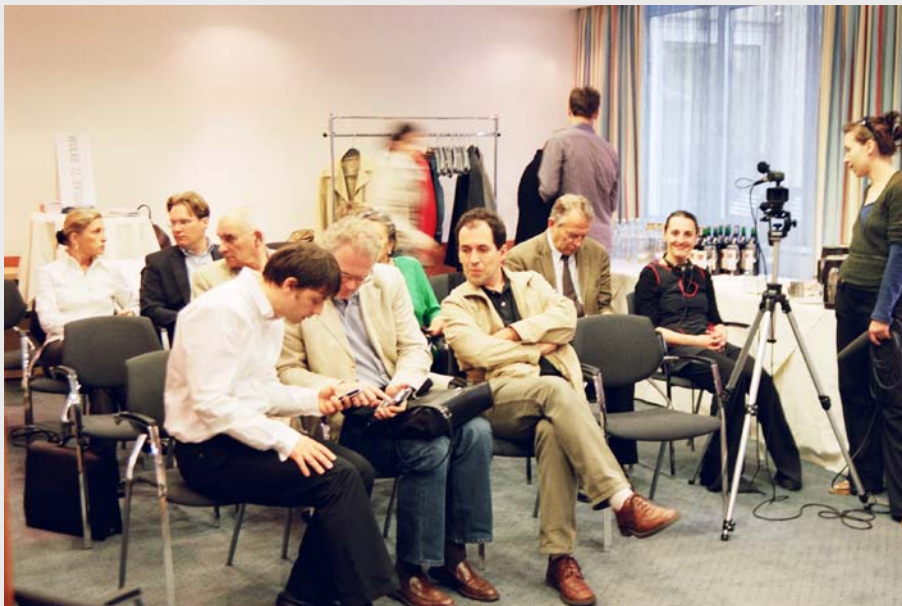
Podium „Ihr Haus – unsere Straße“, Mai 2006

Mai 2006: Podiumsveranstaltung mit ExpertInnen in Zusammenarbeit mit der BV 07 und GB 06-07