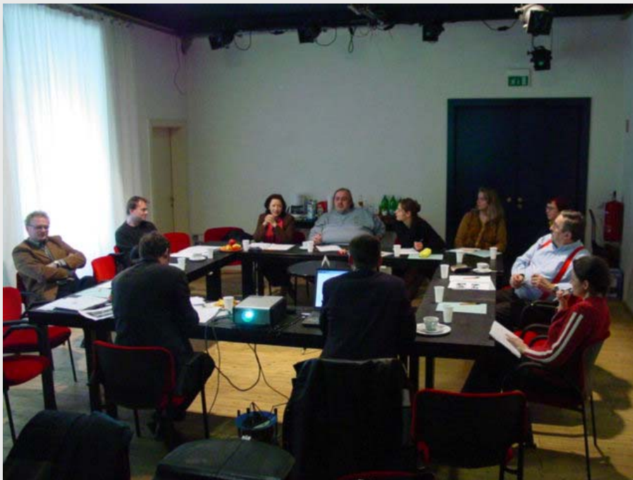
Grätzelkonferenz 2004, Theater SPIELRAUM