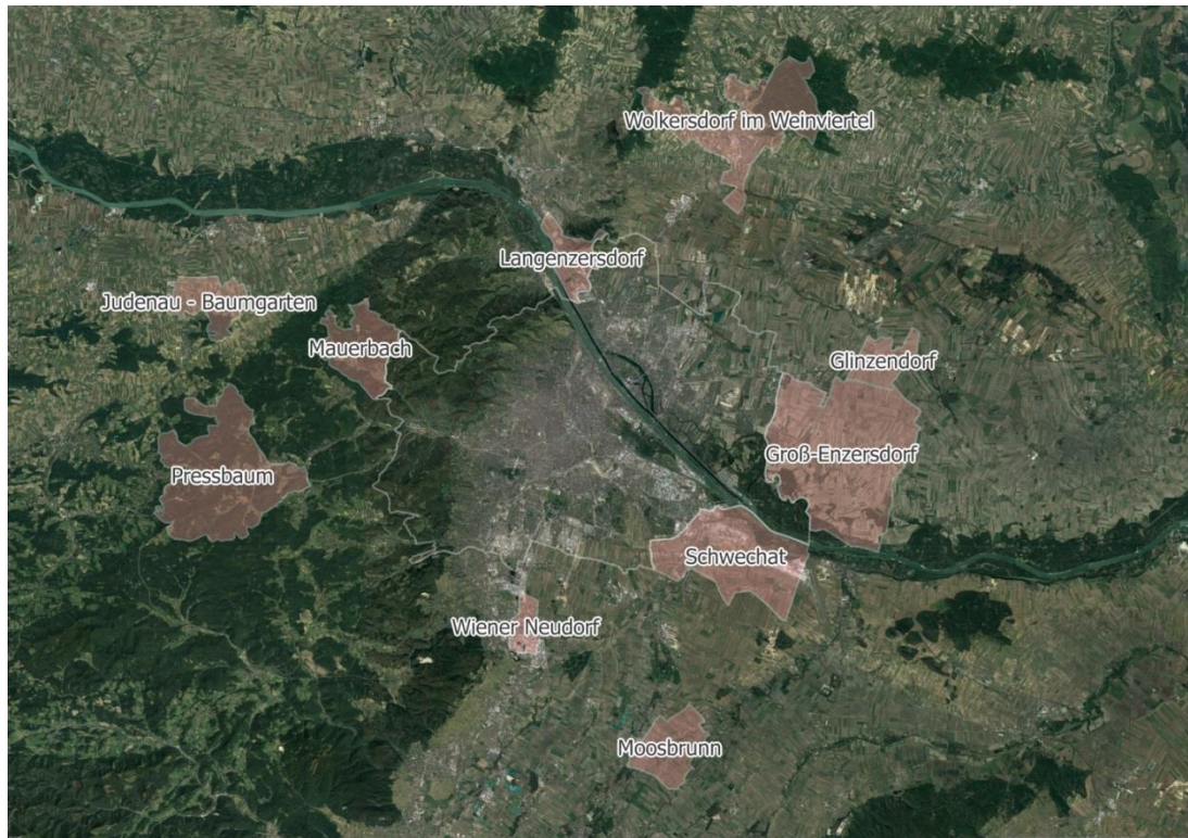
Abbildung 2: Gemeinden