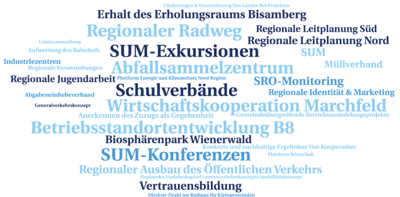
Abbildung 3: Word Cloud Erfolgserlebnisse