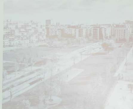
Bednarpark im Nordbahnhofviertel, 2008

– Der Freiraum wurde vor der Siedlung errichtet, Wettbewerb