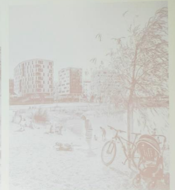
Seestadt Aspern, 2015