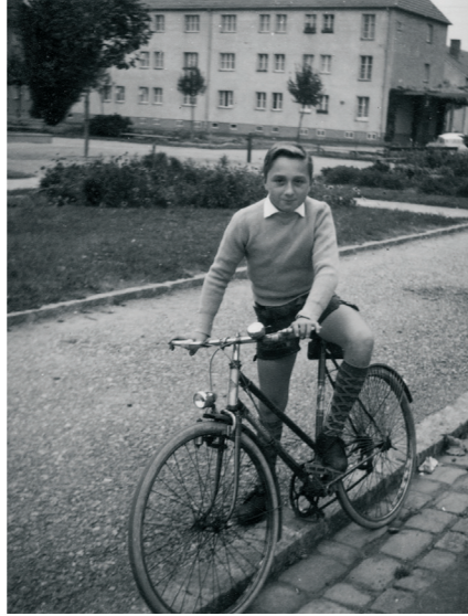
In der Siedlung, um 1960