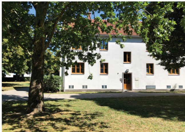
Siedlung Siemensstraße, Scottgasse 5, Stiege 107, Juli 2020