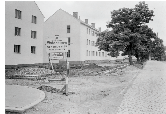
Siedlung Siemensstraße im Bau, 1953 Österreichische Nationalbibliothek, Bildarchiv, Inv. Nr. 507736 C

Geschäftsgruppe Wohnen, Wohnbau, Stadterneuerung und Frauen