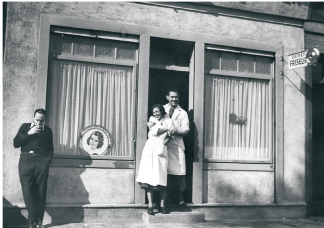
Friseur in der Berzeliusgasse, 1950er-Jahre