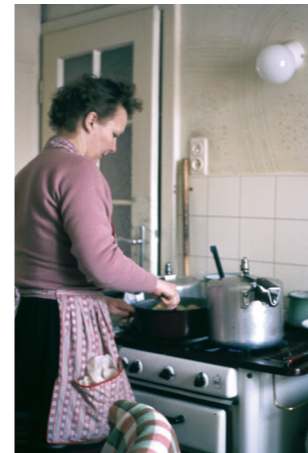
Oben: Am Küchentisch, 1960er-Jahre.