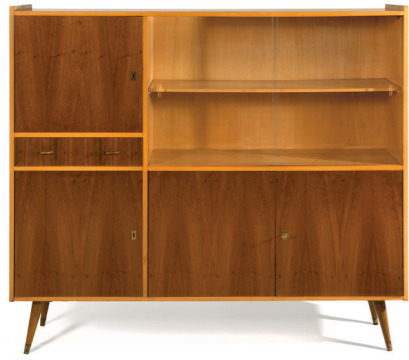
Vitrinschrank aus der Aktion Soziale Wohnkultur, 1960 Foto: Birgit und Peter Kainz, Wien Museum, Inv. Nr. 237940