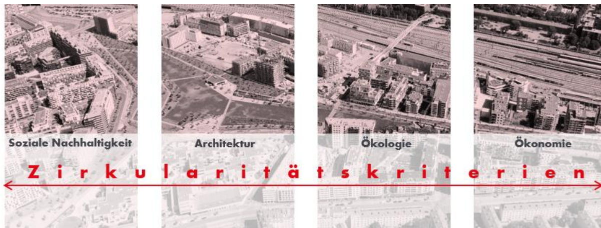
Abbildung 1: Kreislaufwirtschaft als Querschnittsthema, eigene Darstellung (© UIV) auf Basis eines Fotos von der Stadt Wien: https://www.wien.gv.at/spezial/vonoben/favoriten/?i=16 .

Die steigende Nachfrage nach Rohstoffen, die Endlichkeit materieller Ressourcen und die Auswirkungen der Rohstoffgewinnung und -verwendung auf die Umwelt (Stichwort CO 2 -Emissionen) machen deutlich, dass das Thema Ressourcenschonung wesentlich stärker als bisher in den Fokus der wirtschafts- und klimapolitischen Betrachtung rücken muss. Dem Bauwesen kommt dabei aufgrund des hohen Rohstoffeinsatzes eine Schlüsselrolle in der Umsetzung von Ressourceneffizienz zu. Die Kreislaufwirtschaft zielt darauf ab, die Wertschöpfung vom Verbrauch endlicher Ressourcen abzukoppeln. Von der Europäischen Kommission wurde die Kreislaufwirtschaft daher im Rahmen des European Green Deals als das Instrument genannt, mit dem die Gestaltung einer nachhaltigen und ressourcenschonenden gebauten Umwelt gelingen soll.