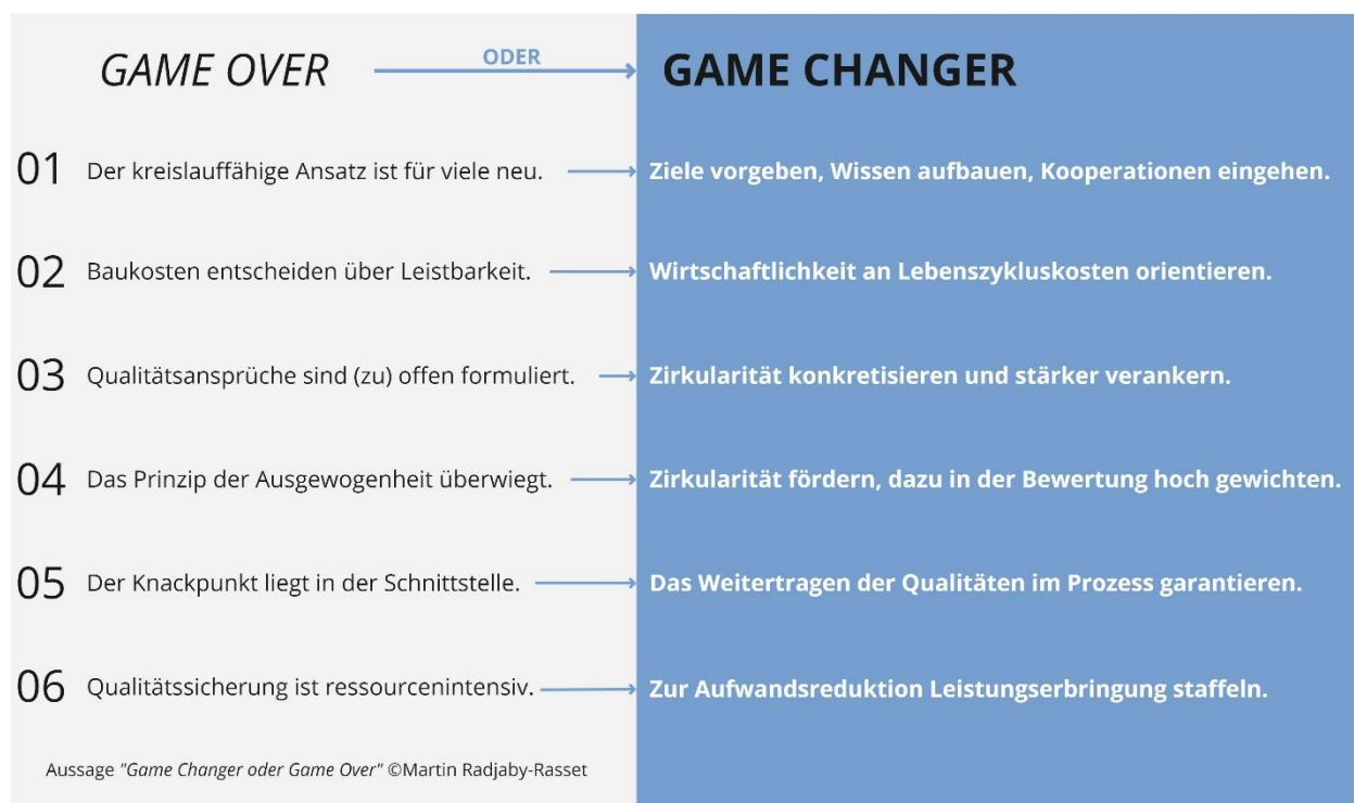
Abbildung 3: Gegenüberstellung von Konflikten/Herausforderungen und Lösungsansätzen, eigene Darstellung (© UIV)

Die gewonnenen Erkenntnisse und Einschätzungen wurden zu sechs Barrieren zusammengefasst, die einem kreislauffähigen Wohnbau derzeit entgegenstehen. Jeder dieser Hürden, die leicht zum Scheitern des zirkulären Gedankens führen können („Game Over“), wurde ein innovativer Handlungsansatz, also ein „Game Changer“, gegenübergestellt, der geltende Regeln hinterfragt, Vorschläge für neue Mechanismen macht und so zur schrittweisen Implementierung der Kreislaufwirtschaft im Qualitätsmanagement des geförderten Wohnbaus beiträgt.